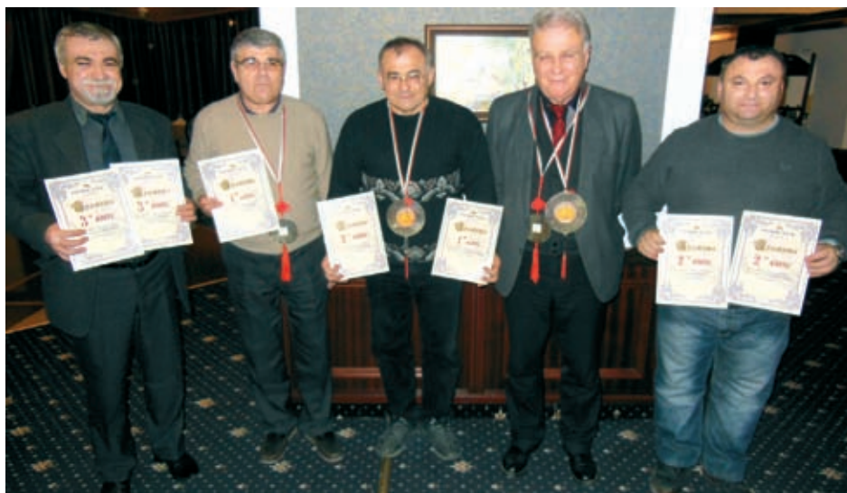
Петимата победители и призьори

РОТАРИ КЛУБ ЦЕНТРАЛ ПРАВИТЕ ПЛАНОВЕ НАБЛЮДАВАТЕ НАПРЕДЪКА ПОСТИГАТЕ ЦЕЛИТЕ