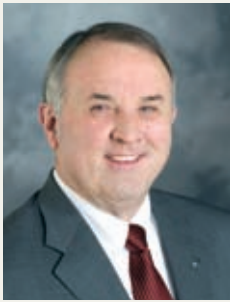
В Интернет Речи и новини от президента на РИ Рон Бъртън ще намерите на www.rotary.org /office-president